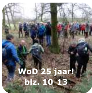
WoD 25 jaar! blz. 10-13