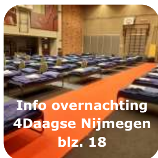
Info overnachting 4Daagse Nijmegen blz. 18