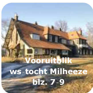
Vooruitblik ws-tocht Milheeze blz. 7-9