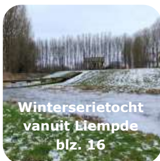
Winterserietocht vanuit Liempde blz. 16